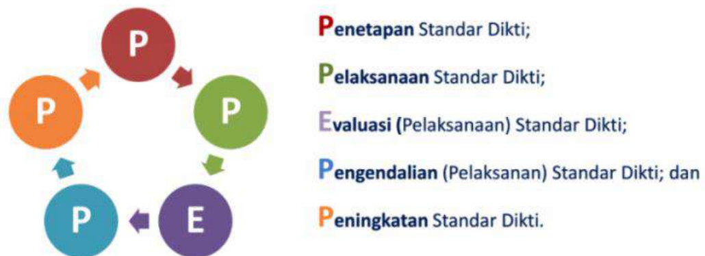
Gambar 1. Siklus SPMI

Mekanisme SPMI UNTAD diawali dengan mengimplementasikan SPMI melalui siklus kegiatan yang disingkat sebagai PPEPP , yaitu terdiri atas: